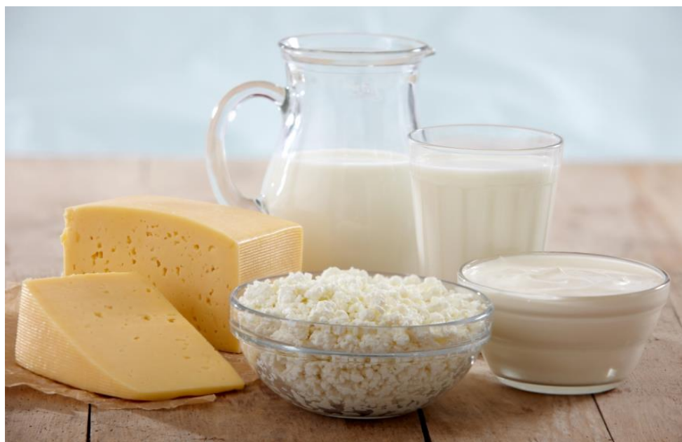
7-nji surat. Düýe süýdünden taýýarlanýan önümler

Düýe süýdünden taýýarlanýan önümler. Düýe süýdünü tehnologiýa taýdan işläp, islendik süýt-gatyk, mesge ýagy, syr, guradylan süýt we ş.m. ýaly azyk önümlerini öndürmek bolýar. Türkmenistanda düýe süýdi çal, agaran we az mukdarda doýran öndürmek üçin ulanylýar.