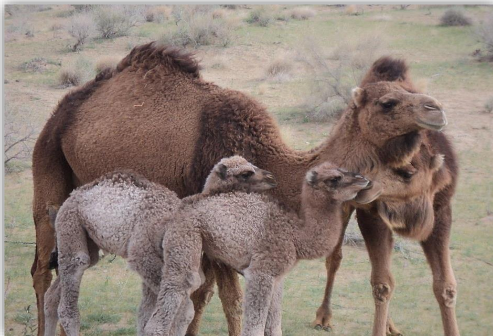
3-nji surat. Köşekli düýe

Howanyň maýyyl günleri 15-20 günlük köşekleri eneleri bilen 3 kilometrden uzak bolmadyk öri meýdana bakmaga çykarmak bolar. Howa sowasa, köşekleri ýatakda saklamaly. Agylda saklanylýan döwri köşekleriň iým ahyrynda daş duzunyň bölegini goýmaly, bogdaklanan ýorunja bedesini asyp goýmaly, köşekler ony iýip otugmaly.