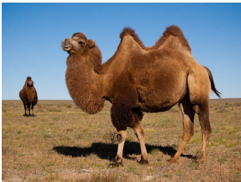
10-njy surat. Iki örküçli baktrian tohumly düýe

Düýeleri tohumara çakyşdyrmak usuly –iki örküçli baktrian tohumlaryny köpeltmekde giňden ýaýrapdyr. Şunda Galmyk baktrianlary gazak we mongol düýeleriniň hilini gowulandyrmak maksady bilen çakyşdyrylýar. Gazak baktrianlaryny mongol düýeleri bilen çakyşdyrmak Gazagystanda ýylboýy örüde saklamaga çydamly düýeleri almaga kömek edýär.