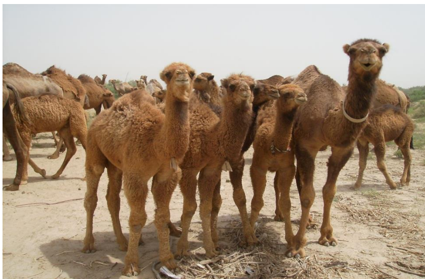
6-njy surat. Torulmar

Düýeleriň saklanylyşy. Düýeler uzak örülerde sürüleýin saklananda, suwa ýakylýan oýlarda ýerli gurluşyk serişdelerinden ýataklar gurmak gerek bolýar. Fermalarda, öri meýdanlarda köp suwly guýularyň ýanynda ýatak jaýlary, saraýlary gurmak gerek. Tomus aýlary uzak örülerde düýeleri gabamak üçin, ýelden sowa ýerlerde meýdan ýatak ýerlerini, ygalary ulanmak bolar.