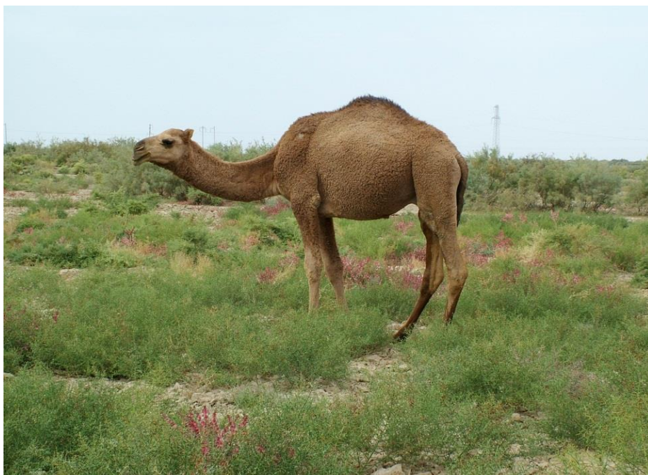
9-njy surat. Arwana tohumly inen düýe

Arassa tohumda köpeltmek. Düýe tohumlaryny köpeltmekde tohumyny arassa köpeltmek esasy usul bolup, onuň maksady ýokary önümlü düýeleriň nesil çeşmesini döretmekdir, bu bolsa erkekleri seçip almak, ylmy taýdan maksadalaýyk jübütleşdirmek we tohum köşekleri ösdürip ýetişdirmek ýaly meseleleri öz içine alýar. Iki örküçli we bir örküçli düýeleriň tohumlarynyň ýaýran ýerlerine baglylykda, öz gymmatly taraplary bardyr. Çalasyň hereketli düýeleriň arap ýurtlaryndaky tohumlary, türkmen arwana düýesi, iki örküçli baktrianlaryň galmyk, gazak we mongol tohumlary ýerli şertlere we belli-belli önüm bermeklige uýgunlaşan bolup, olaryň tohumy arassa köpeldilip kämilleşdirilýär. Tohumy arassa köpeltmekde ugurlar boýunça köpeltmek, garyndaşlykda we garyndaş däl köpeltmek, arwana düýedarçylygynda bolsa ene inenler maşgalasyny göz önünde tutup köpeltmek ýaly usullar ulanylýar.