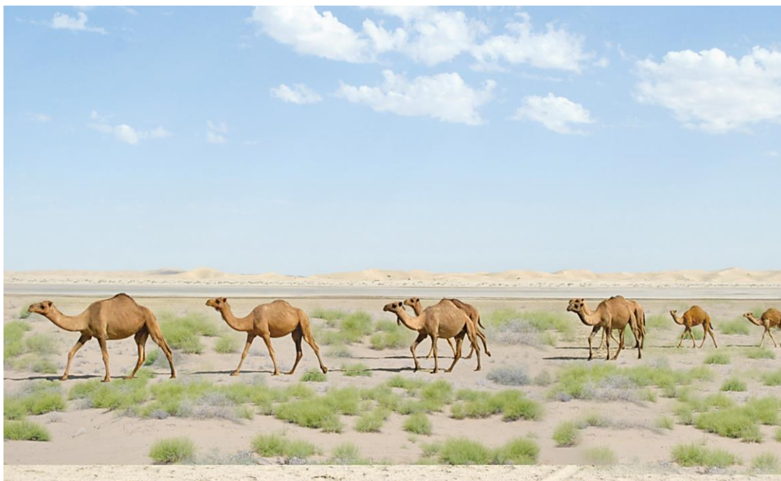
1-nji surat. Düýe sürüsi öri meýdanda

Arwana düýeleriniň esasy ýaýran ýerleri Garagum sähraşydyr. Ulgam-ulgam gum depeleri, takyrlar we şor ýerlerdüýeler üçin öri meýdanlary bolup hyzmat edýärler. Olar sazak, çerkez, çaly, gandym ýaly gyrymsy agaçlar, garak, borjak ýaly şor otlar, ýowşan, selin, ýabagan ýaly otlar bilen iýmitlenýärler. Oazislere golaý ýerlerde düýeler, esasan, ýandak, selme, syrkin ýaly otlary iýýärler, Garagumdaky özüde duzy köp saklaýan guýularyň suwlaryny içip oňup bilýärler. Arwana düýeleri garaköli goýnundan beýleki mallaryň oňup bilmeyän örülerinde iýmitlenip we köpeli bilýärler. Arwana düýeleri gazaply sowuk howa dözümsizdirler. Ýaz, bahar aýlary çöllük örülerde gök otuň, efimer ösümlükleriň ösýän döwründe olar özüni tutýarlar, semizligini dikeldýärler, örküjünde 40-60 kilograma çenli ýag toplan bilýärler.