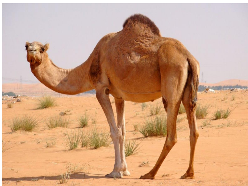
11-nji surat. Arwana tohumly inen düýe

Tohumçylyk hasabatyny ýöretmek. Arwana tohumly düýedarçylyk hojalyklarynda köşekler doglanda, olara at dakylp doglan senesi, reňki, ene-atasy bellige alnyp, resmi ýazgylarynyň hasabaty ýöredilýär. Harytlyk hojalyklarda düýeleriň sany köp bolanda we örülerde saklanyp köpeldilende olaryň her birine at dakyp, hasabatyny ýöretmek kyn bolýar. Düýeler biri-birinden reňki we nyşanlary boýunça kän bir tapawutlanmaýarlar. Bu hojalyklarda ýaş köşekleriň gulagyna san belgilenen syrga dakmak bilen hasaba alnýar, at dakylýar.