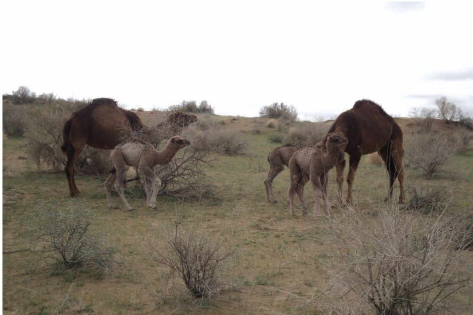
4-nji surat. Köşekli düýeler

köp bolmadyk ýagdaýlarynda köşekleri ene düýeleriň sürüsine goşup saklamak bolar.