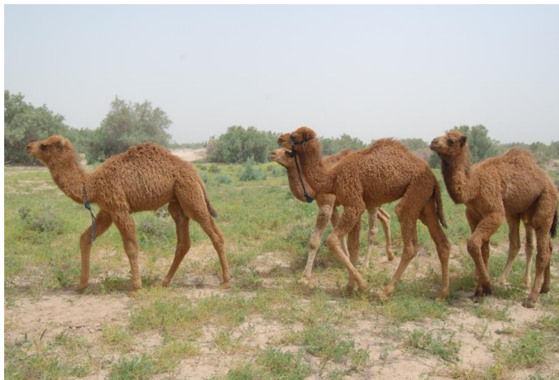
2-nji surat. Köşekler örüde

Köşek emdirýän düýeleriň ýelnini gözegçilikde saklamaly, hapalanmagyna, ýelin agyry bolmagyna ýol bermeli däl. Düýeleriň ýelin agyry zerarly soňra az süýtli bolmagy mümkin. Soňabaka köşekleri her 4 sagatdan gündizlerine we gijelerine emdirmeli.