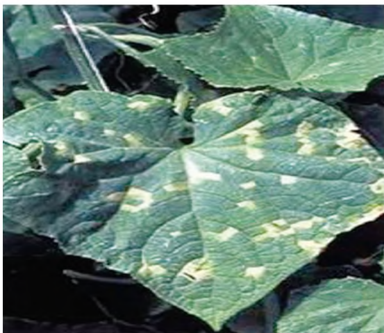
14-nji surat. Ýalan akdüşme bilen kesellän hyýar biýarasý

Kesellere garşy göreş çäreleri. Bakja ekinleriniň kesellerine garşy durnukly sortlaryň sagdyn sortlaryny ekmek, ekin dolanyşygyny geçirmek, meýdanlaryndaky ideg işlerini agrotehnikanyň talaplaryna laýyklykda alyp barmak, kesellän ösümlikleriň galyndylaryny aýryp, zyýansyzlandyrmak ýaly çäreler ýüze çykýan keselleriň azalmagyna we önüniň alynmagyna ýardam edýär. Himiki serişdelerden keselleriň görnüşlerine baglylykda, maslahat berilýän fungisidleri (mysal üçin, ridomil gold, patamil, topaz ýa-da fullpas) ulanmaly.