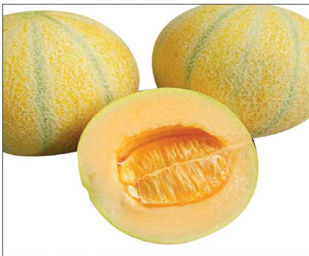
2-nji surat. Gawunyň Kyrkgünlük sorty

Kyrkgünlük ir ýetişýän sort, köpçülikleýin gögerip çykandan soň 50–60 günden bişip ýetişýär. Bu sortuň gawunlary togalak, paçagy ýuka, ortaça agramy 0,8–1,5 kg. Miwesiniň tagamy süýji, gandyň mukdary 10–12%-e ýetýär. Ol terligine peýdalanylýar. Bu gawuny köp wagtlap saklap bolmaýar. Kak etmäge, uzak ýerlere alyp gitmäge ýaramsyz.