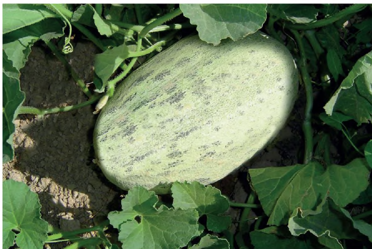
6-njy surat. Akmaral sortunyň ýetişen döwri