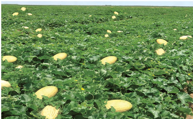
1-nji surat. Gawunyň ýetişen hasly

Türkmen gawunlary öz bişip ýetişýän döwürleri boýunça 4 topara bölünýär. Ir bişýän gawunlara kyrkgünlük, zamça, zaamy,