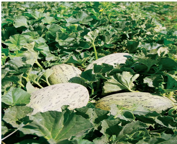
7-nji surat. Gawunyň ýetişen döwri