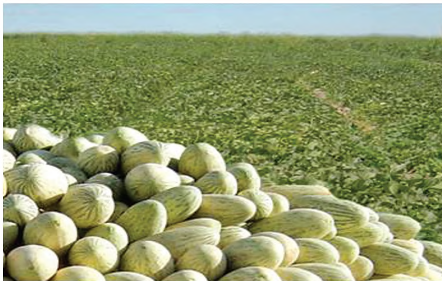
15-nji surat. Gawunyň ýygnalan hasyly

Bakja ekinleriniň miwe emele getirip başlan döwründen bişip ýetişmegi üçin ekilýän sortlaryň ösüş döwrüne baglylykda 20 günden 70 güne, kähalatlarda ýylyň gelşine baglylykda ondan hem köp möhlet talap edilýär.