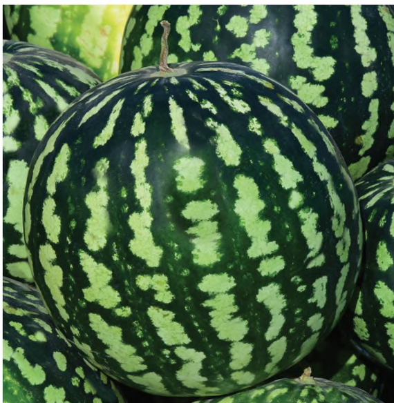
9-njy surat. Garpyzyň Serdar sorty