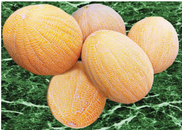
4-nji surat. Gawunyň Gyzyl gülaby-498 sorty

Miwesiniň agramy 3–6 kg, hasyllylygy her gektardan 25–30 tonna. Bişen miwesindäki gandyň mukdary 16–17%. Gyşa saklamaga we uzak ýerlere daşamaga ýaramlydyr.