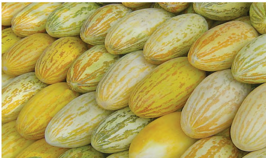
3-nji surat. Gawunyň Waharman sorty

Gyzyl gülaby-498 – türkmen sorty, tohumlary ekilip köpçülikleýin gögerip çykandan soň 90 – 95 günden ýetişýär. Miwesi süýnmek ýumurtga şekilli, keşde-torly. Eti ak, galyň dykyz hem ter, şireli.