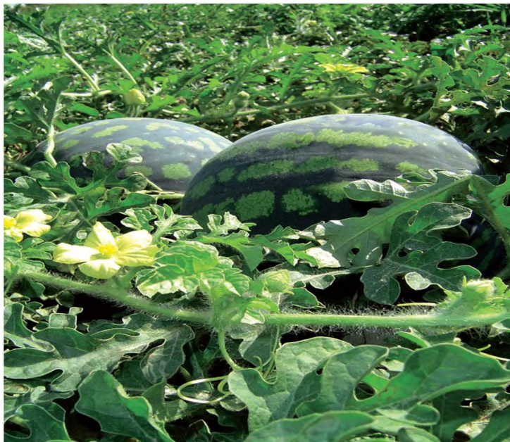
8-nji surat. Garpyzyň Bereketli sorty

Bereketli – bu ir ýetişýän sort bolup, tohum köpçülikleýin gögerip çykandan soň 70–75 günde ýetişýär. Miwesi şar şekilli, daşy