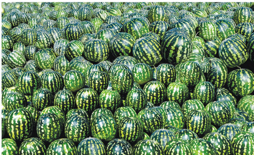
10-njy surat. Garpyzyň ýygylan hasyly