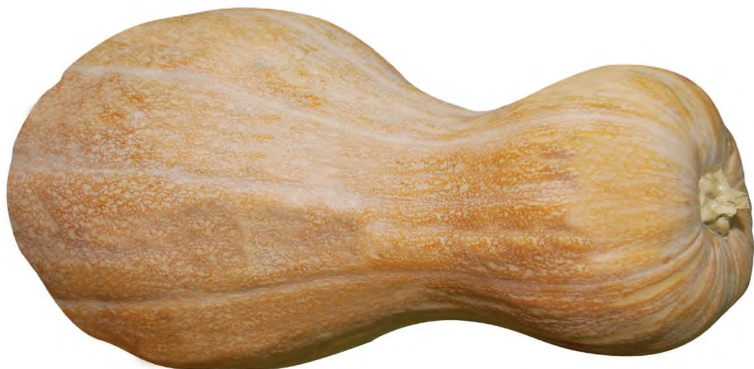
11-nji surat. Palaw kädi

Palaw kädi – bu ýerli sort bolup, ýurdumyzda ir döwürlerden bäri ekilip gelinýär. Onuň tohumlary köpçülikleýin gögerip çykandan soň 105–110 günde ýetişýär. Bu sortuň kädisi uzyn, armyt görnüşli, bili bogdaklydyr. Bişen kädisiniň reňki sary bolup, paçagy ýuka bolýar. Agramy 4–6 kg -a ýetýär. Bu kädiniň eti dykyz we tagamy süýjüdir. Bişen kädiniň düzümindäki gandyň mukdary 11%-e ýetýär. Her gekardan alynýan hasyl 25–30 tonna ýetýär.