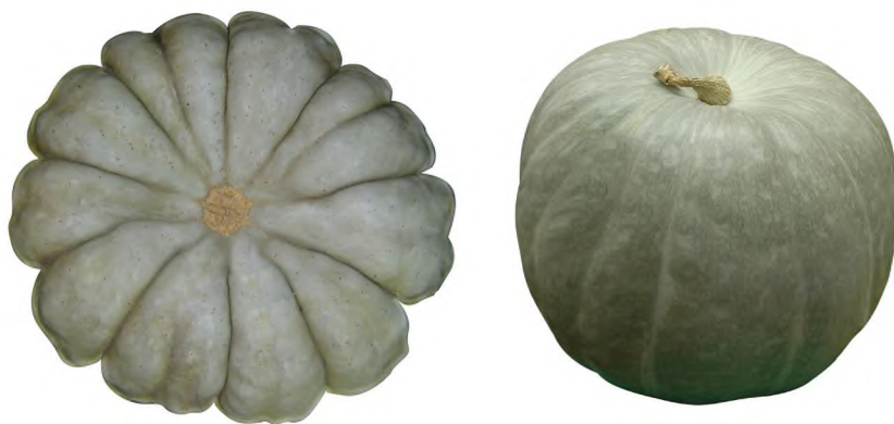
13-nji surat. Han kádi

ýerleşýän boşlugynyň ululygy ortaça, sarymtyl reňkli. Türkmenistanyň şertlerinde bu kádi ýokary hasyl berýär. Ony uzak wagtlap saklap bolýar we uzak ýerlere daşamaga ýaramlydyr.