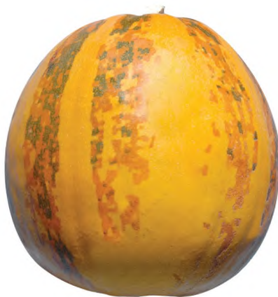
12-nji surat. Ýerli daş kádi